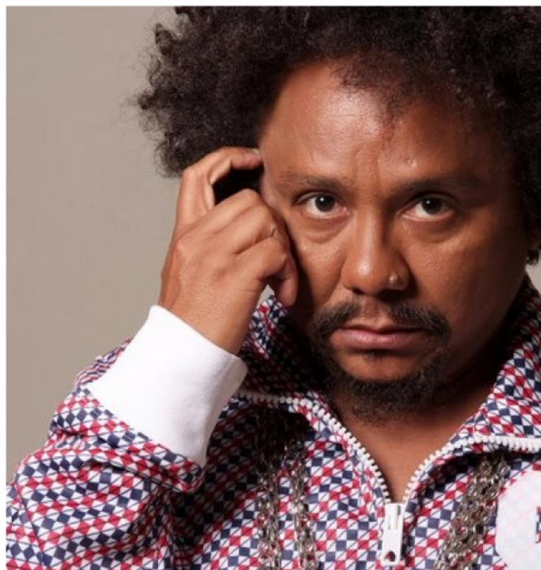
Chico César, jornalista, compositor, cantor, e ex-secretário de Cultura da Paraíba é uma das referências da música popular brasileira.

Uso também outras estratégias para integrar conhecimentos: trabalho com gravuras que estimulam a percepção visual dos alunos; incentivo à confecção de receitas de comida