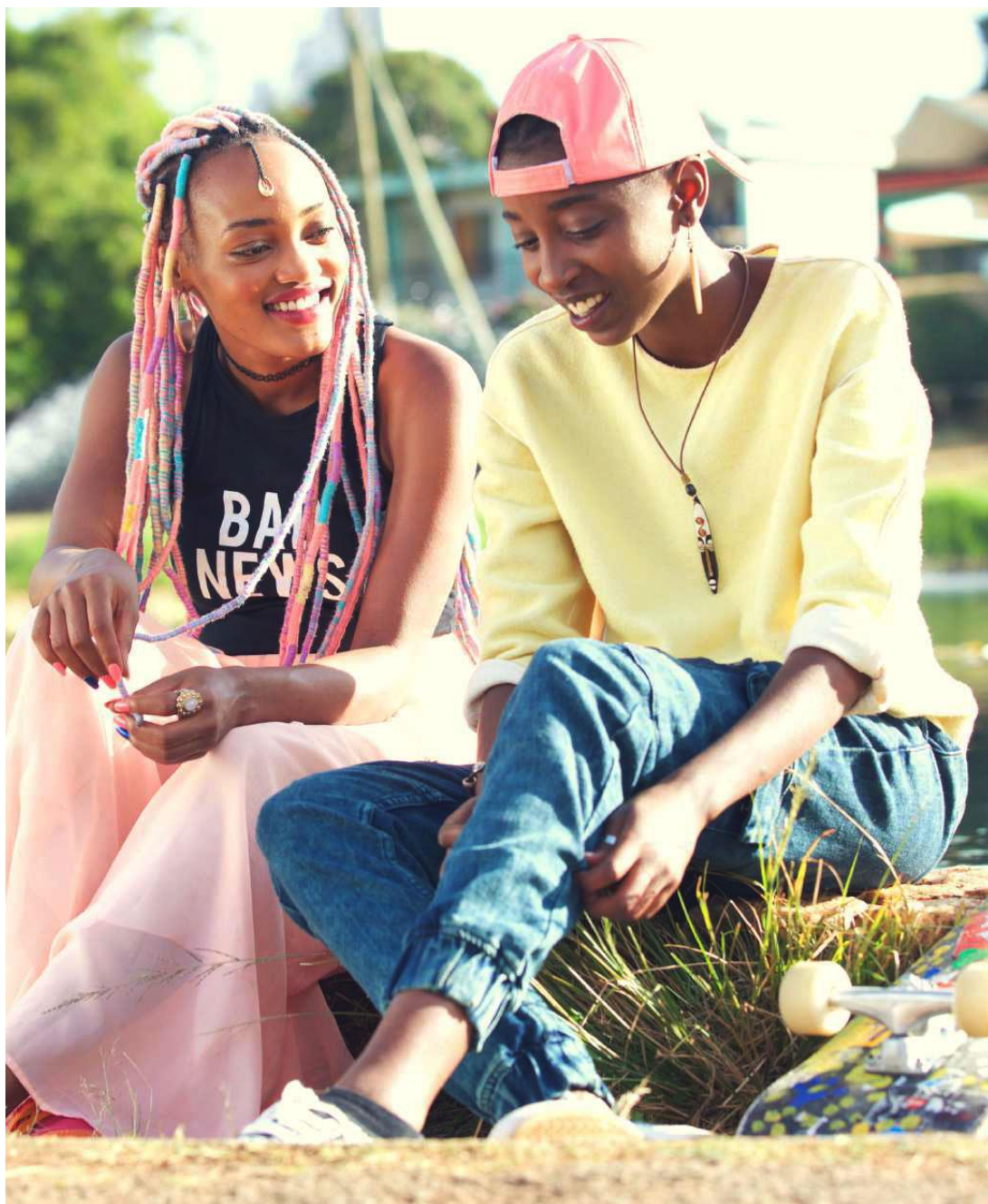
Imagens do filme Rafiki, de Wanuri Kahiu.

“Rafiki” significa "amigo" em swahili 6 (uma das línguas oficiais do Quênia e uma das mais faladas no continente). Ocorre que se trata de “amigo” no sentido mais restrito - designação dada aos casais homossexuais que tentam disfarçar sua condição, afinal a prática homossexual é passível de até 14 anos