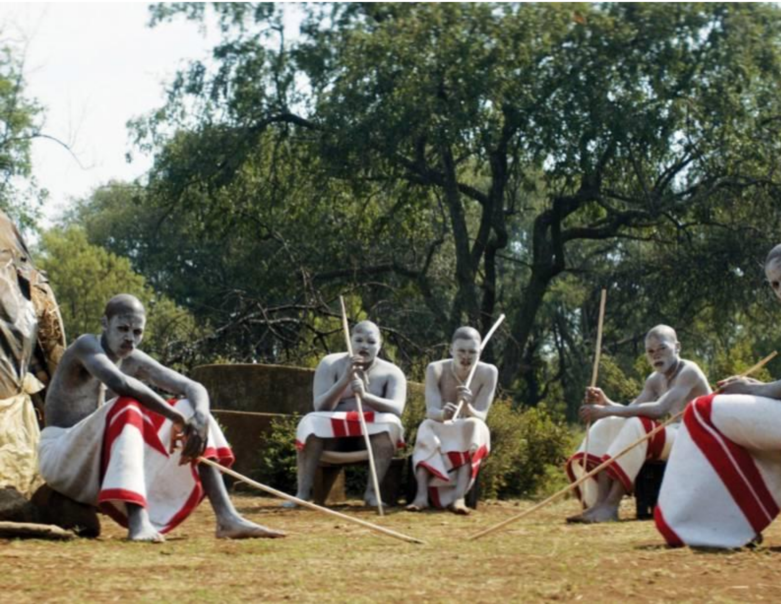
Imagens do filme "Os iniciados", de John Trengove

que os meninos estão sendo cortados (sem qualquer assepsia ou anestesia) e são obrigados a não chorar enquanto gritam: “eu sou homem”.