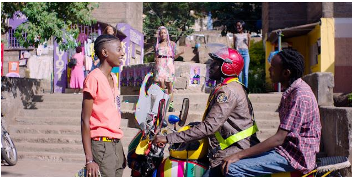
Imagem do filme “Rafiki”

“Acreditamos em uma representação divertida, feroz e frívola da África. Para isso, trabalhamos para curar, comissionar e criar trabalhos divertidos que celebrem a alegria. Somos contadores de histórias, fabricantes de roupas, designers gráficos, músicos, amantes da vida, arautos da alegria, promotores da beleza, anunciadores da esperança. Com links para presença online existente, celebramos a amplitude de curadores, colecionadores e criadores que já celebram a alegria, o amor e a felicidade da África por meio de seu trabalho.” ( https://www.afrobubblegum.com/ )